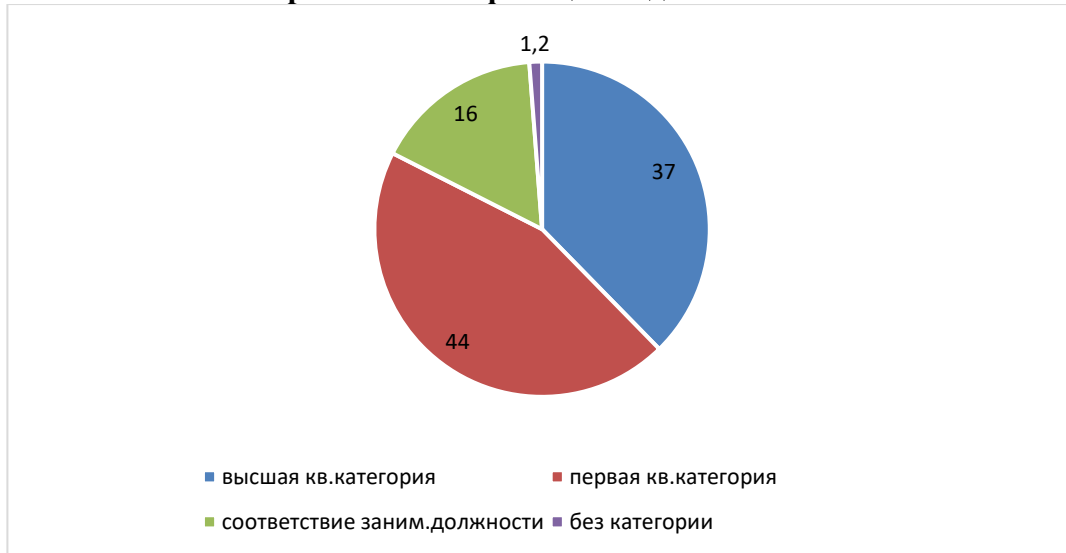
Уровень квалификации педагогов в %

Стаж работы (педагогической деятельности) имеют до 3 лет - 2 (6%) педагога, от 3 до 5 лет- 1 (3%) педагогов, от 5 до 10 лет -1 (3%) педагога, от 10 до 15 лет – 0 (0%) педагогов, от 15 до 20 лет – 12 (38%) педагогов, свыше 20 лет – 16 (50%) педагогов.